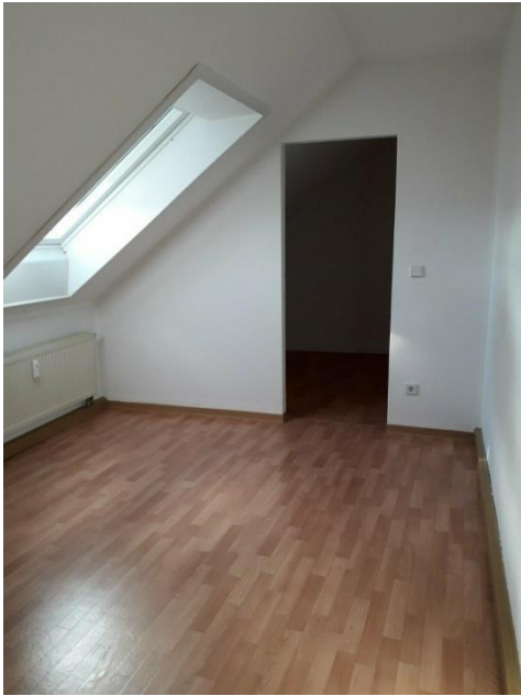
Schlafzimmer mit Ankleide